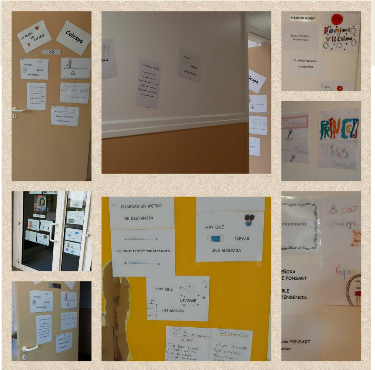
Photographies des murs et portes du collège Vauban à Givet.

Dans le cadre du projet Euroscol, nous avons décidé de montrer au monde entier (au moins !), par l'intermédiaire de ce journal, les projets que nous menons avec des collégiens autour des langues. En effet, notre collège propose l'apprentissage de plusieurs langues : anglais, espagnol, allemand, latin, grec ancien et évidemment français. En choisissant des projets communs pour fêter des événements comme la journée des langues, ou encore la journée des morts, nous souhaitons que les élèves perçoivent la richesse des langues européennes et les liens qui existent entre chacune d'entre elles. Le titre de ce journal prend alors tout son sens : « coll » pour collège (ou bien « cum » qui signifie en latin « ensemble, avec », « lingu » pour langue et « actu » pour « actualité ». Nous souhaitons donc par l'intermédiaire de ce journal, vous tenir au courant des projets mis en place au sein du collège autour des langues (et croyez-nous, il y en a !). Alors, n'ayez pas votre « langue » dans votre poche, et parlez-en autour de vous ! 😊