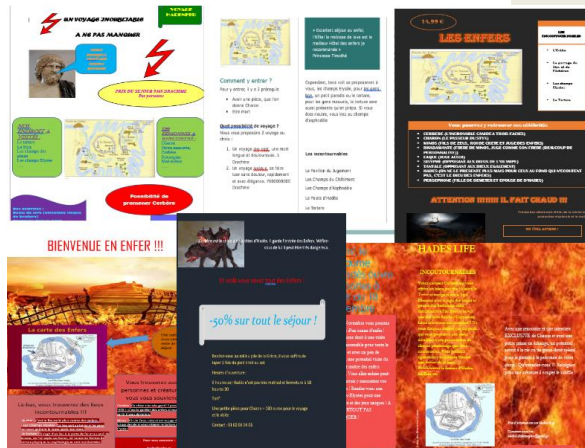
Quelques guides touristiques des enfers réalisés par les hellénistes de 3 e .