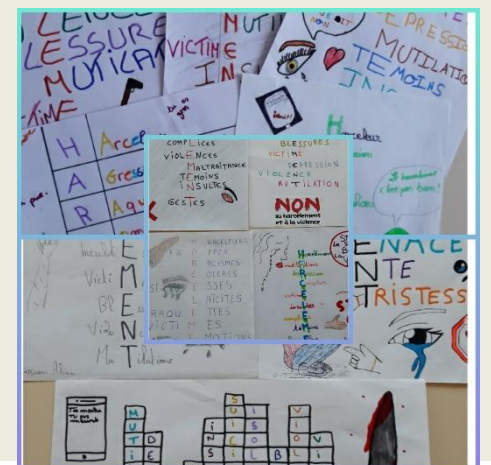
Productions des élèves de 5e1 de Mme Flahutez