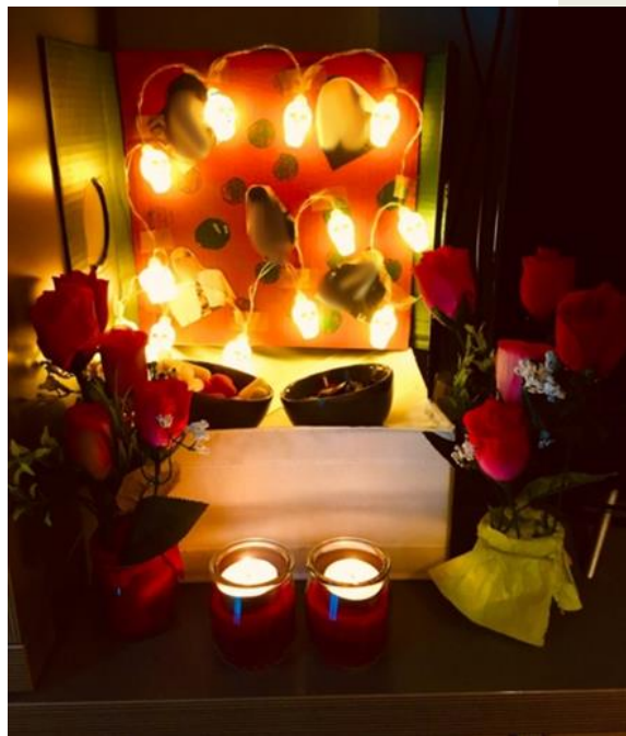
Autel réalisé par un élève de 6 e bilangue espagnol.

Otra fecha importante es el 2 de mayo porque será el día internacional contra el Acoso Escolar o Bullying como se dice en inglés.